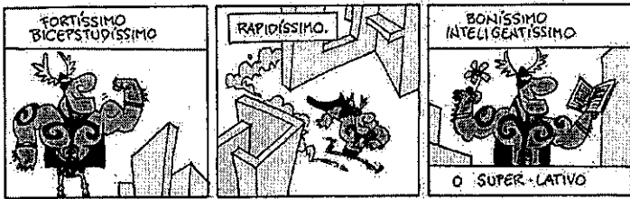
GONSALES, Fernando. Folha de São Paulo, 23.8.24.