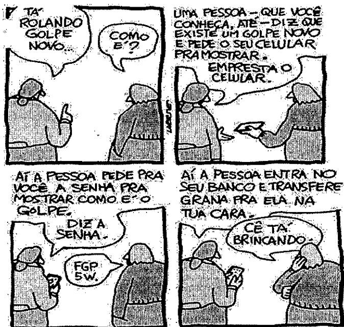
LAERTE. Folha de São Paulo, 24.8.24.